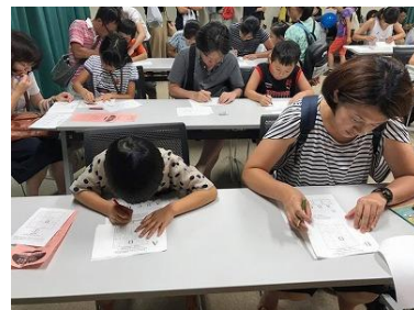
計算大会は年齢制限なし