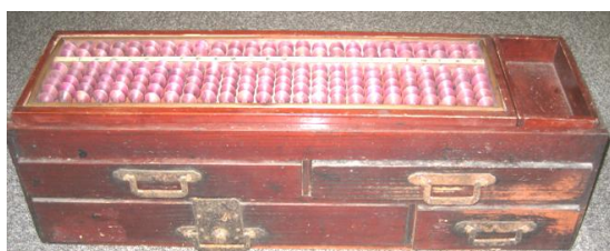
大型銭箱そろばん