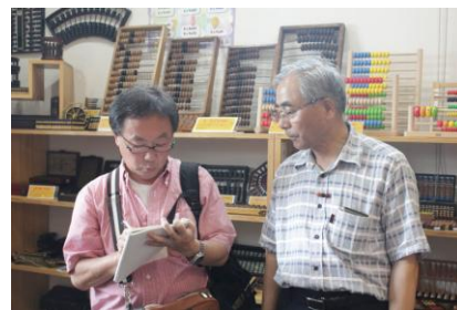
地元誌の取材です。