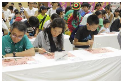
恒例のはしソロは今年も大接戦