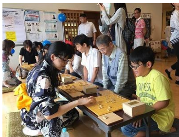
将棋の多面指しは大人気