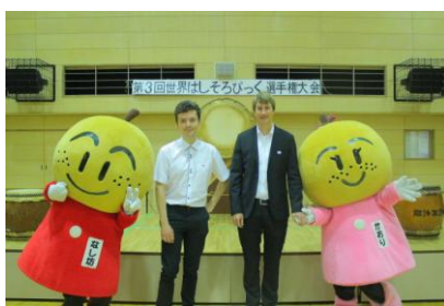
なし坊と外国の参加者